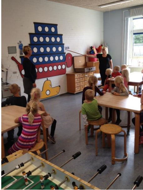
Vi snakker om navne på ting