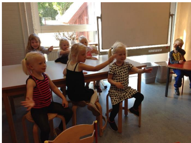
Børnene laver S bevægelsen!