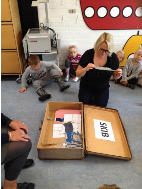
Der står mange bogstaver!!