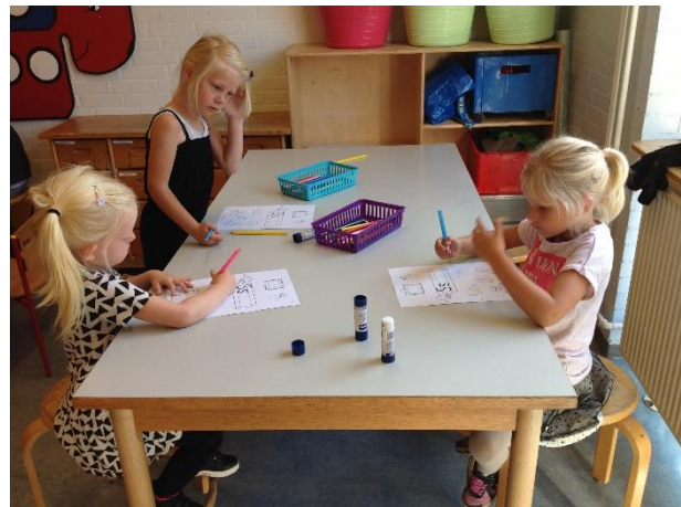
..... og de arbejder