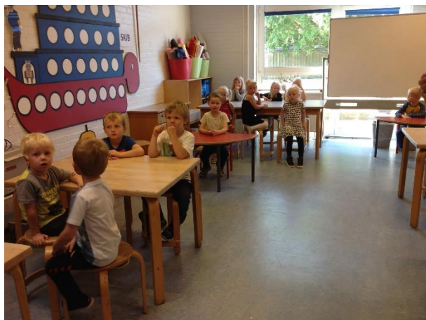
Der bliver læst en historie om slangen Sussi