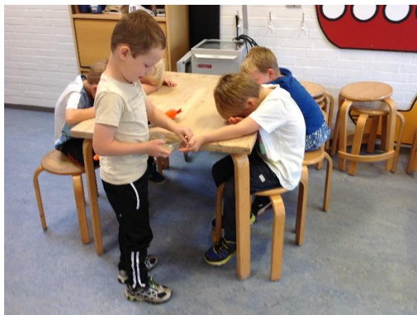
Milas deler en gave ud fra slangen Sussi