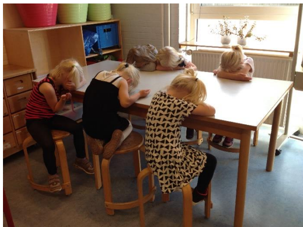
Børnene gemmer sig mens.....