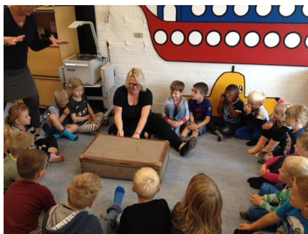
Tør vi Åbne!!