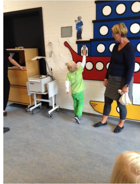
Der bliver trykket ind i stavelser