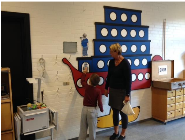
Vi leger med navn på ting og skal trykke dem ind på Robotten Roberts mave